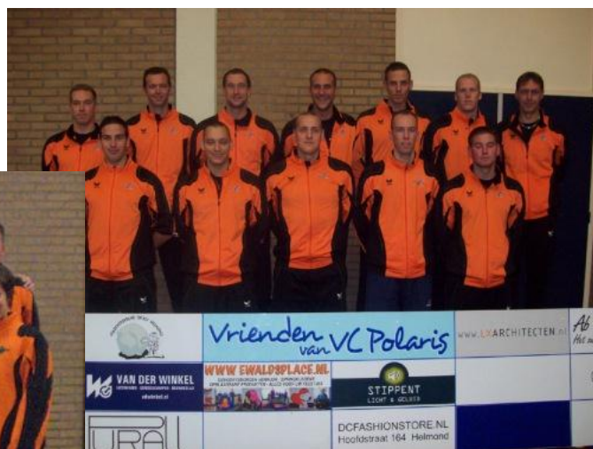
Heren 1 seizoen 2010-2011