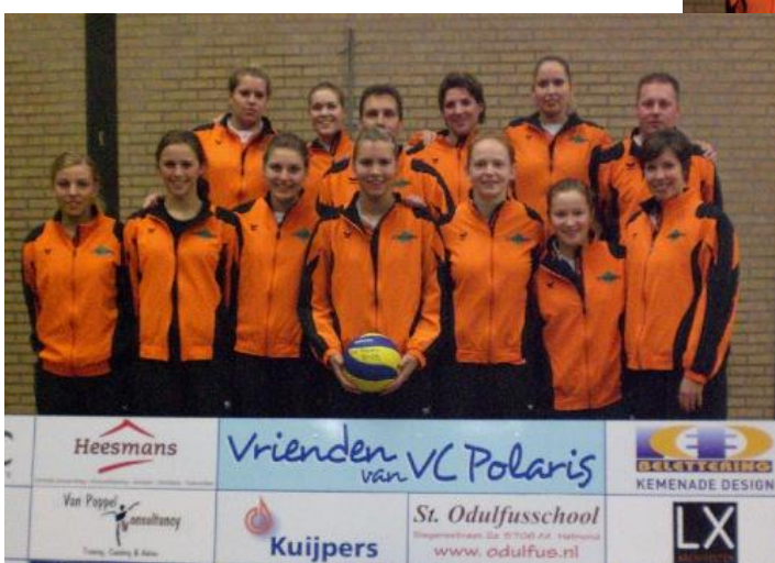
Dames 1 seizoen 2010-2011